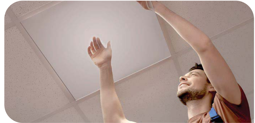
Незаметный монтаж в любые подвесные потолки с ячейкой 600х600 мм