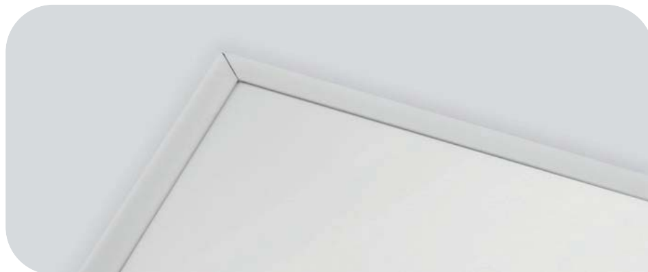
Новейший нагревательный элемент и двойная теплоизоляция обеспечивают максимально эффективный обогрев

Легкая конструкция корпуса не требует усиления конструкции подвесного потолка. Максимальная эффективность обогрева достигается благодаря двойной теплоизоляции с применением дополнительного экранирования, снижающей потери тепла на нагрев оборотной стороны прибора. Четыре дополнительных элемента крепежа позволяют при необходимости подвесить прибор на тросах. Обогреватели упаковываются в индивидуальную коробку.