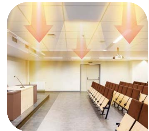
Комфортный равномерный обогрев